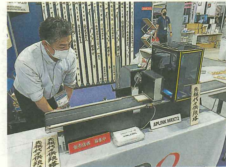
東京ビッグサイトにおける卒塔婆印刷のデモンストラーション

ドはストレスを感じさせない。③「有機溶剤中毒予防規則」に該当しない安全なインクを使用し環境にも優しい。④省スペース・省コスト。事前準備は不要なし。印刷内容の変更も瞬時にできる⑤超速乾のUV硬化インクを使用しているため、印刷時に紫外線を照射する。問い合わせは同社マーケティング部電話06(6369)2711。